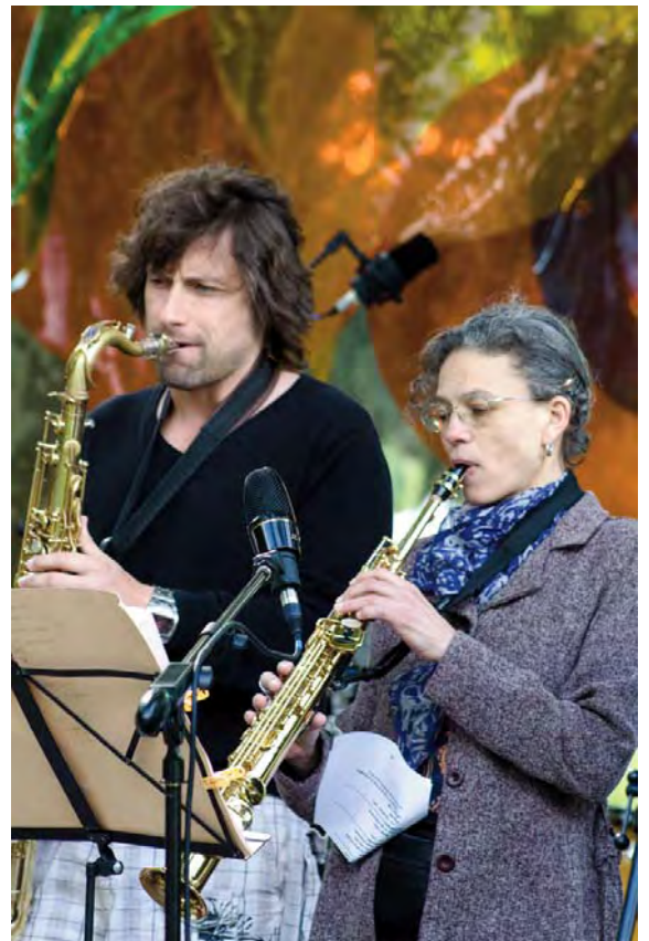
Deux élèves du jazz band