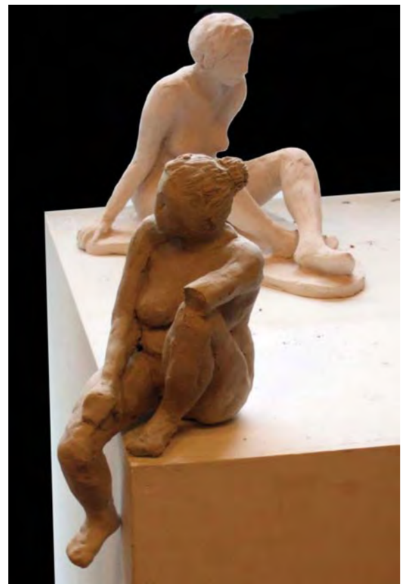
Deux beautés classiques