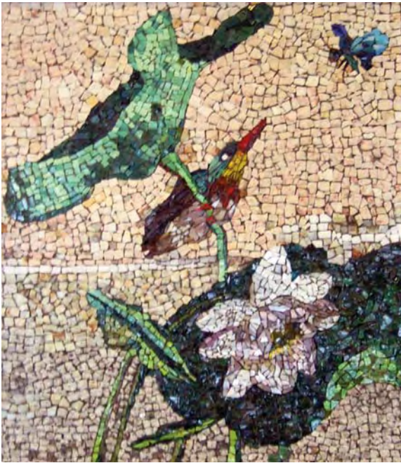
Un petit oiseau, un papillon s'aimaient d'amour tendre !!

LES ADULTES S'EXPOSENT :ateliers de peinture, céramique, modelage de terre et mosaïque