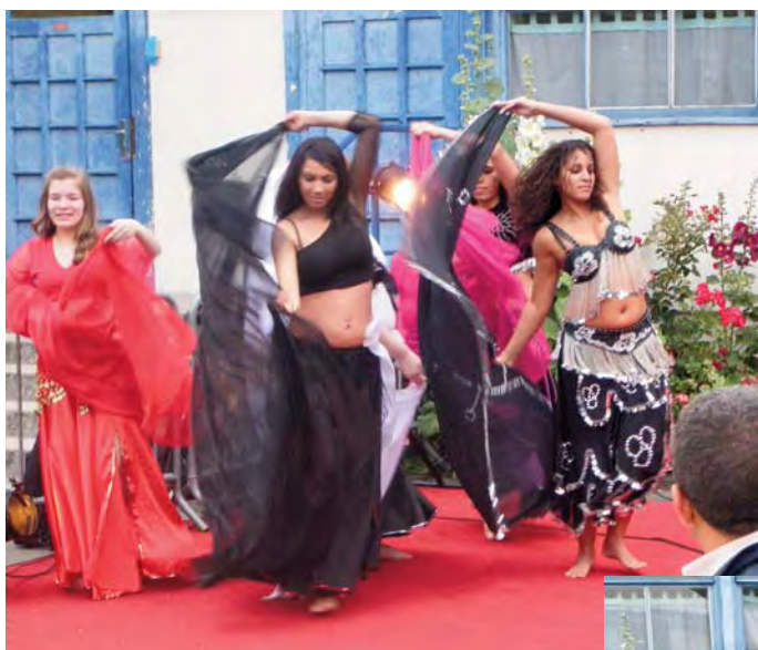
Chez les élèves du cours de danse orientale, les couleurs s'harmonisent