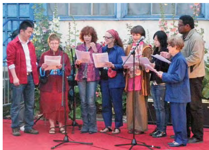
Le cours de chinois s'exprime en musique