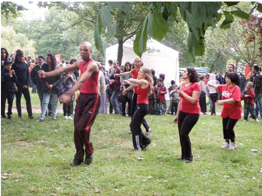
Les élèves du cours de Gym -danse avec leur professeur