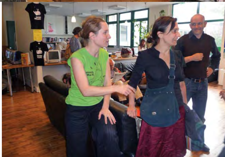
Le professeur d'arts plastiques communique sa joie !