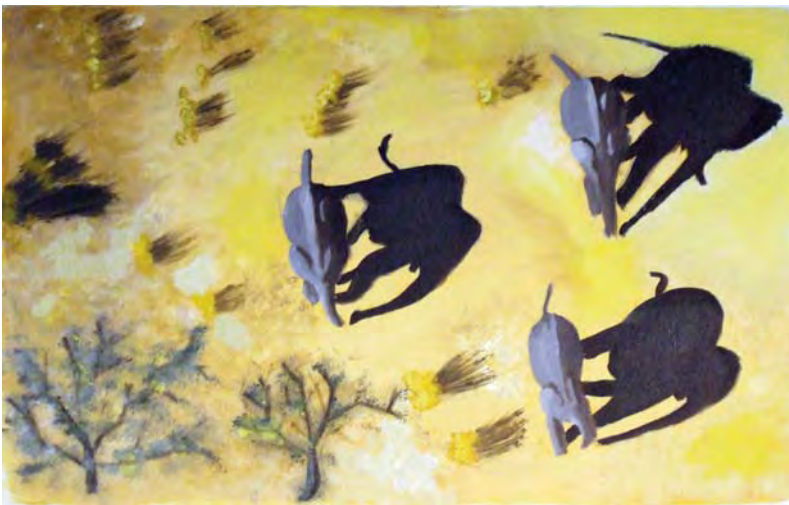
Eléphants dans la savane (Vous pouvez tourner le journal en tous sens!)