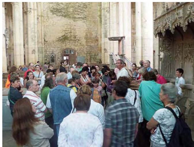
les amapiens dans l'abbaye, visite assurée par M. le Maire