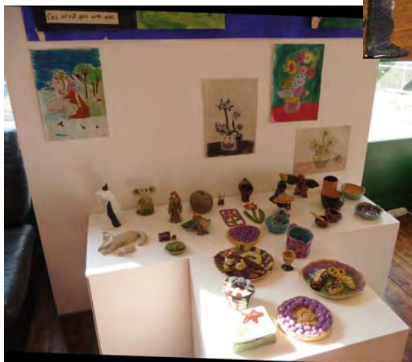
Exposition Arts plastiques enfants : on en mangerait !