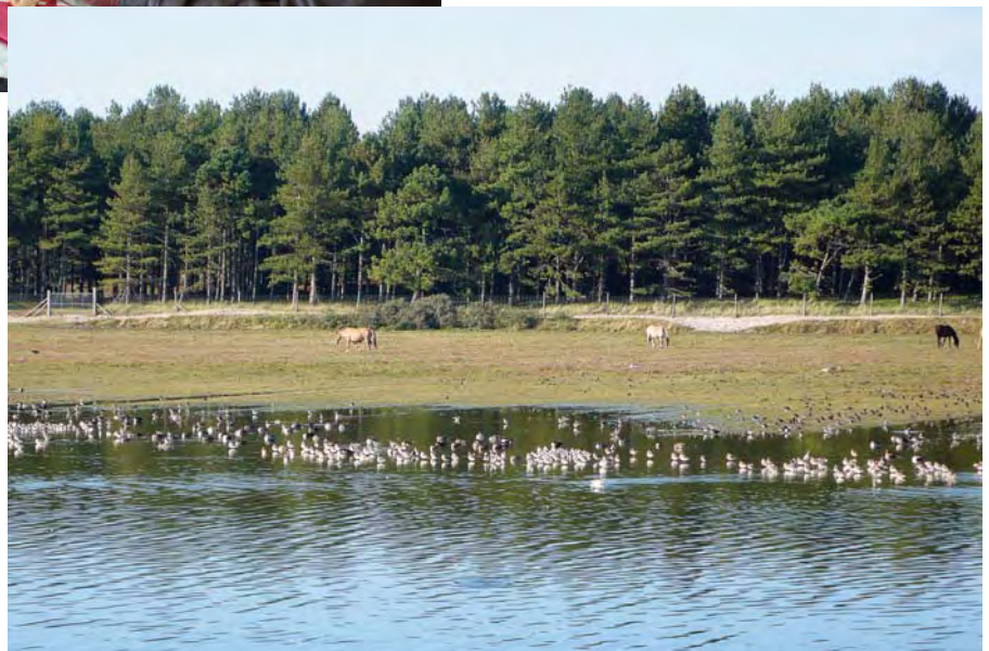
La réserve d'oiseaux