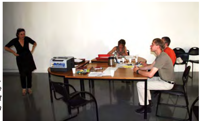
Dès le 25 juillet, l'équipe s'installe dans le centre d'art Mira Phalaina

Depuis la rentrée et encore actuellement :