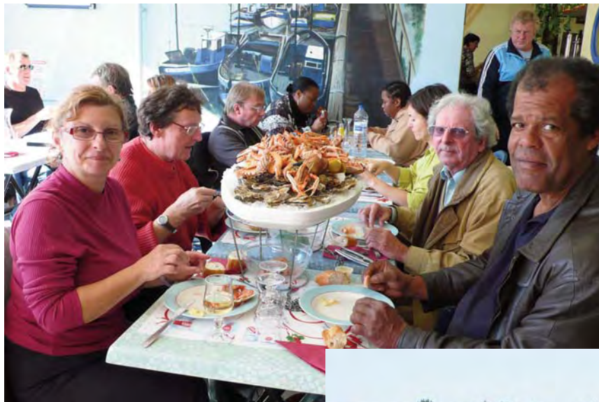
Rien à ajouter !