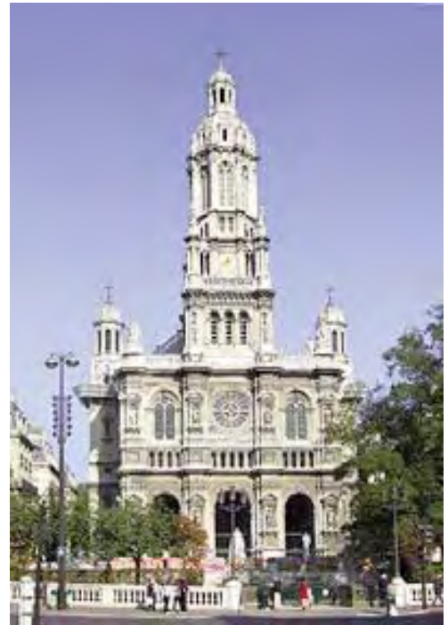
Eglise de la Trinité à Paris

Par sa profondeur spirituelle et sa richesse théologique, son œuvre permet d'approcher les grands mystères de la foi à travers le langage musical. Il a fait refléter dans sa musique les lumières que sa soif de Dieu avait recueillies. Musicien de la joie, il était naturellement disposé à entendre et restituer la musicalité de la Création, qu'il percevait tout particulièrement à travers les couleurs et le chant des oiseaux.